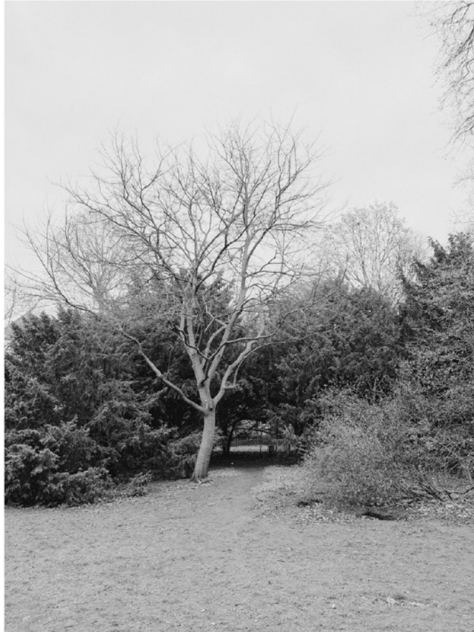
Abb. 1: Alexandre Kurek, unbenannt 1 , Heinrich-von-Kleist Park, Berlin 2024.

Abbildung 1 zeigt einen kargen, blattlosen Baum im Zentrum der Aufnahme. Unmittelbar rechts neben dem Baumstamm erkennt man einen Trampelpfad, der von der vordergründig gelegenen Wiese am Baum vorbei in ein dahinterliegendes Gestrüpp führt. Am Ende des Gestrüpps lässt sich eine Lichtung erkennen. Dieser Trampelpfad ist ein starkes Indiz dafür, dass sich im Laufe der Zeit eine nicht unwesentliche Anzahl von Menschen diesen Ort hinter dem Ort nicht nur durch ein Gehen an sich erschlossen hat, sondern auch durch ein Gehen abseits der dafür angelegten Wege. Entscheidend für meine fotografischen Untersuchungen sind die Aspekte des Gehens und des Gehens abseits der dafür angelegten Wege deshalb, weil ich mich in meiner Arbeit auf Orte konzentriere, die (nicht ausschließlich, aber vornehmlich) nur durch eben dieses Gehen abseits der angelegten Wege erschlossen werden können. Meinem Vorgehen liegt zudem der Gedanke einer den arkadischen Hirten oft zugeschriebenen Freiheit vor gesellschaftlichem Anpassungsdruck zugrunde. Man könnte also sagen, dass sich diejenigen, die heutzutage auf Wegen abseits der angelegten Wege wandern, einem gesellschaftlichen Anpassungsdruck entledigen (wollen).